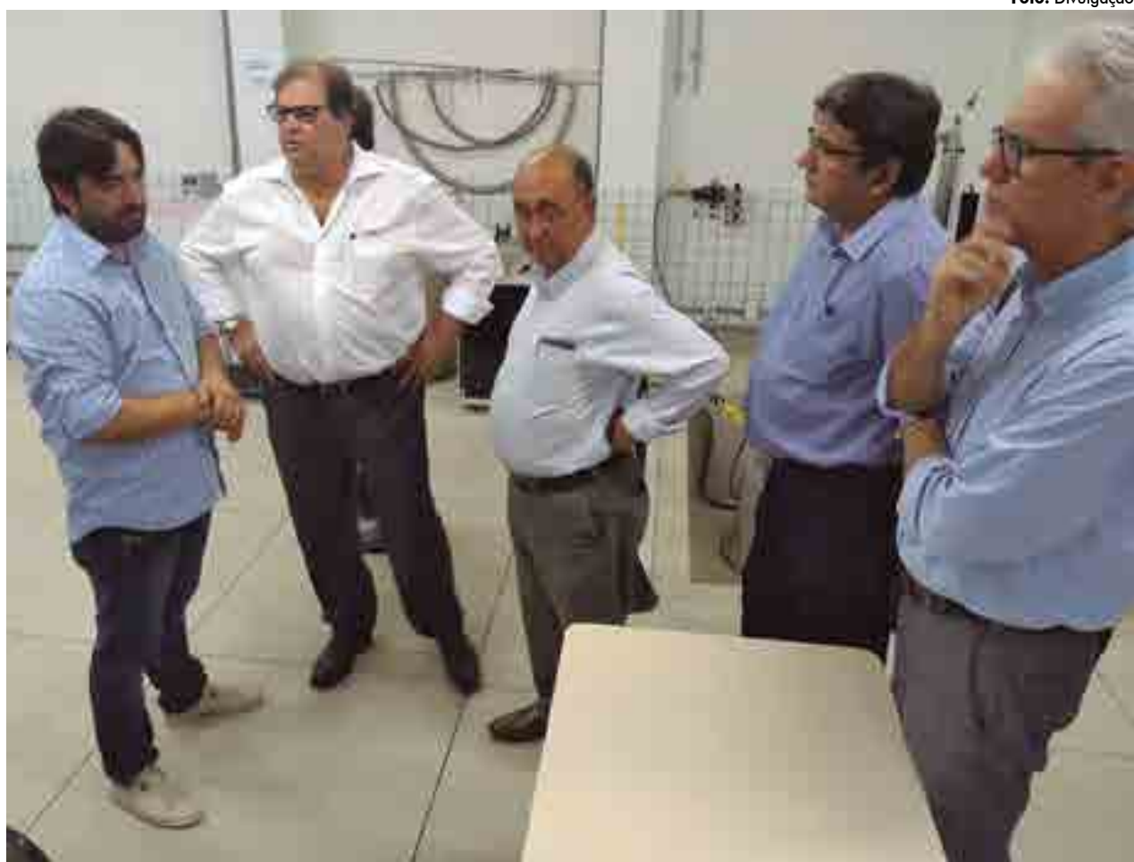
Com a pandemia, o CNPq publicou edital para pesquisas em covid-19 e recebeu 2 mil propostas, uma demanda qualificada de R$ 600 milhões

Com o PLP 135/2020 definitivamente aprovado e sancionado, os recursos vinculados ao FNDCT serão totalmente descontingenciados e integralmente disponibilizados ao fundo para execução orçamentária e financeira após a entrada em vigor.