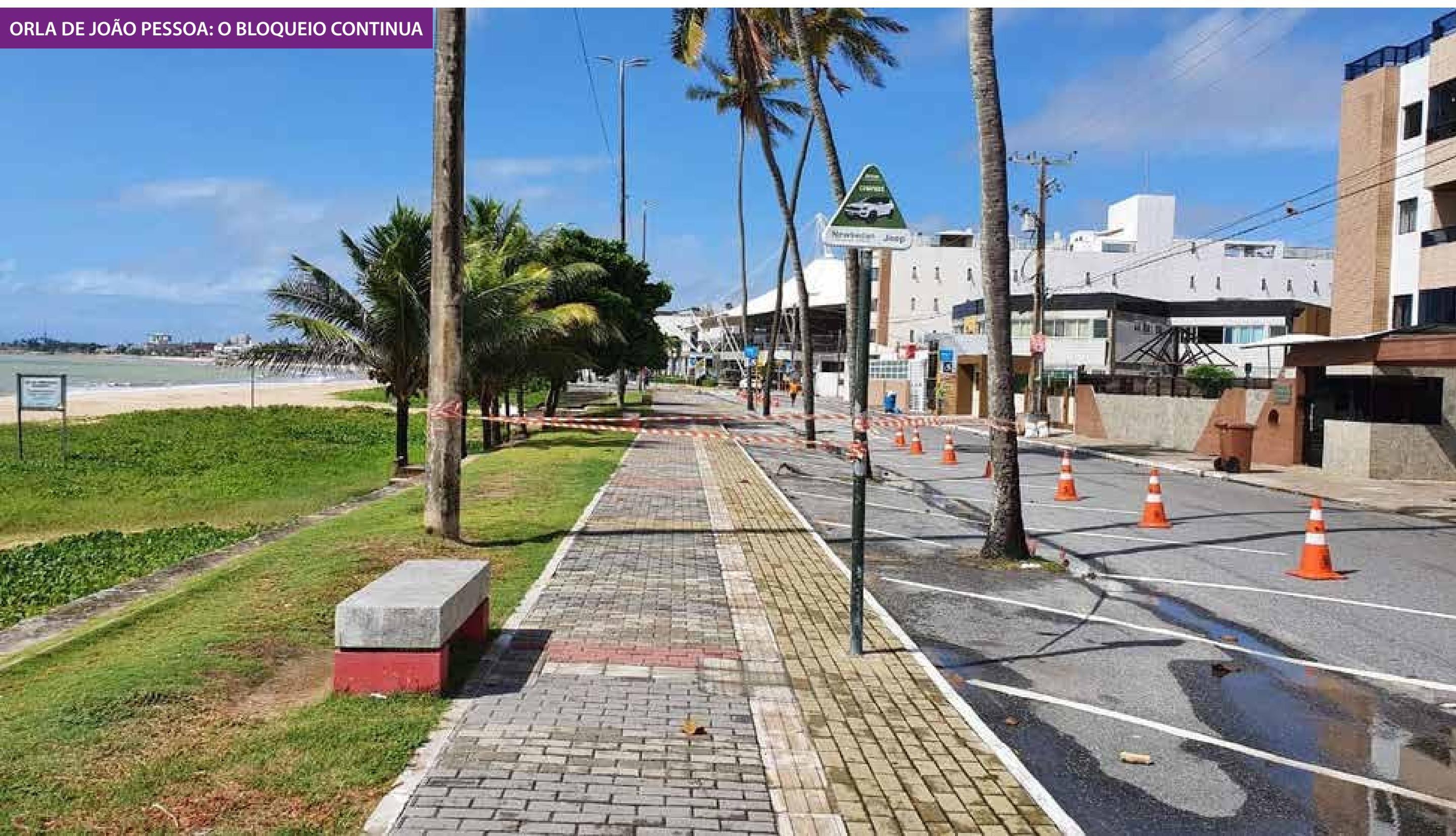
ORLA DE JOÃO PESSOA: O BLOQUEIO CONTINUA

de curvas crescentes de casos e óbitos, em toda a região Nordeste, o Comitê Científico de Combate ao Coronavírus continua apoiando, de forma unânime, a manutenção e ampliação das medidas de isolamento social como única forma eficiente de reduzir o número de contágios e evitar a sobrecarga e o colapso dos sistemas de saúde. A manutenção e ampliação desta medida se fazem, ainda mais urgente, com a constatação do aumento de casos de dengue e chikungunya em toda a região Nordeste e no resto do país”.