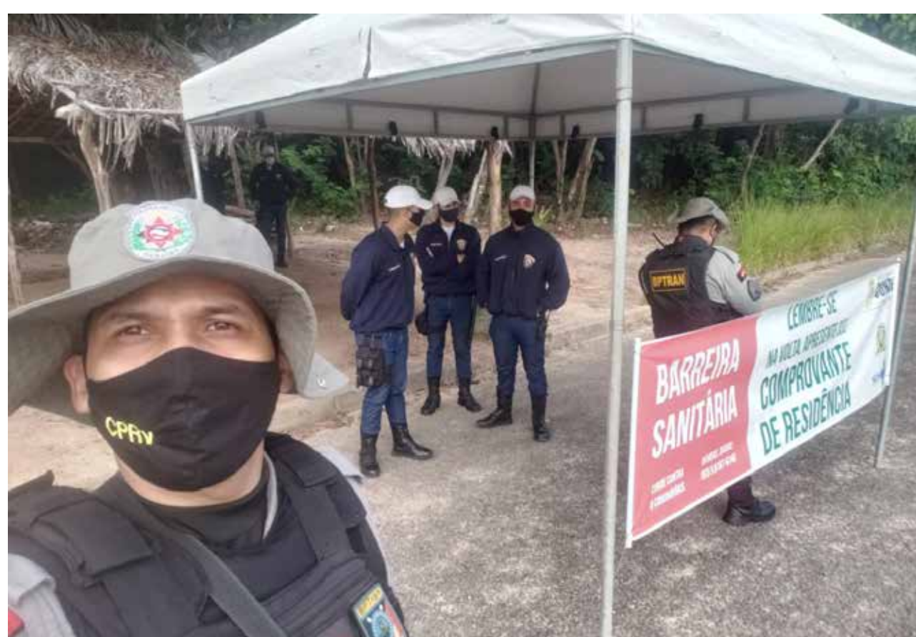
NOVAS BARREIRAS: COMPROVANTE DE RESIDÊNCIA DEVE SER APRESENTADO

Novas barreiras sanitárias foram instaladas pelo Governo, desde a quarta-feira (20), nas rodovias PB-008 e PB-018 (Conde), PB-025 (Lucena), PB-034 (no limite de Alhandra e Caaporã) e PB-044 (no limite de Caaporã e Pitimbu). O terminal hidroviário, de Cabedelo, também foi contemplado.