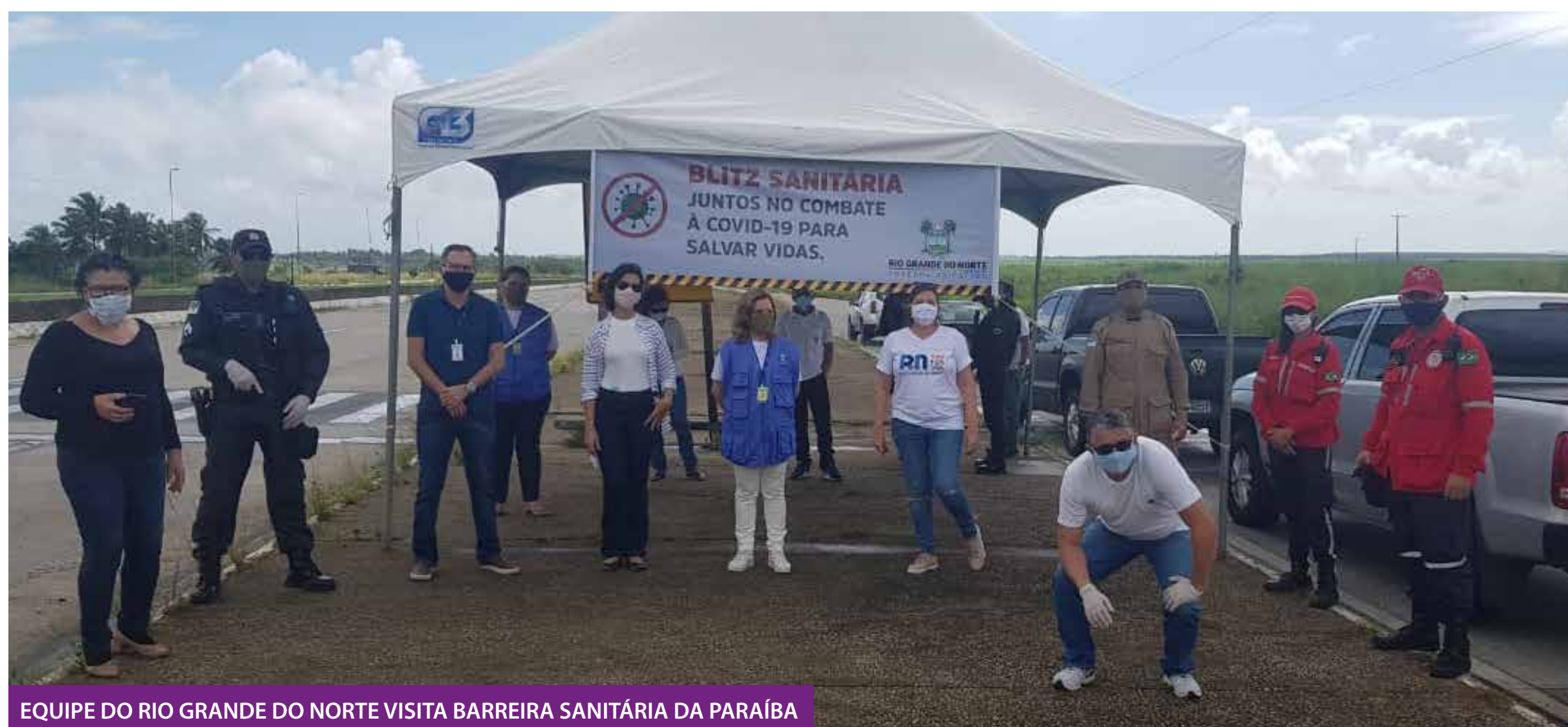
EQUIPE DO RIO GRANDE DO NORTE VISITA BARREIRA SANITÁRIA DA PARAÍBA

Uma equipe do Governo do Rio Grande do Norte, esteve na Paraíba, na quinta-feira (21), para observar como funcionam as barreiras sanitárias instaladas nas divisas paraibanas com outros Estados.