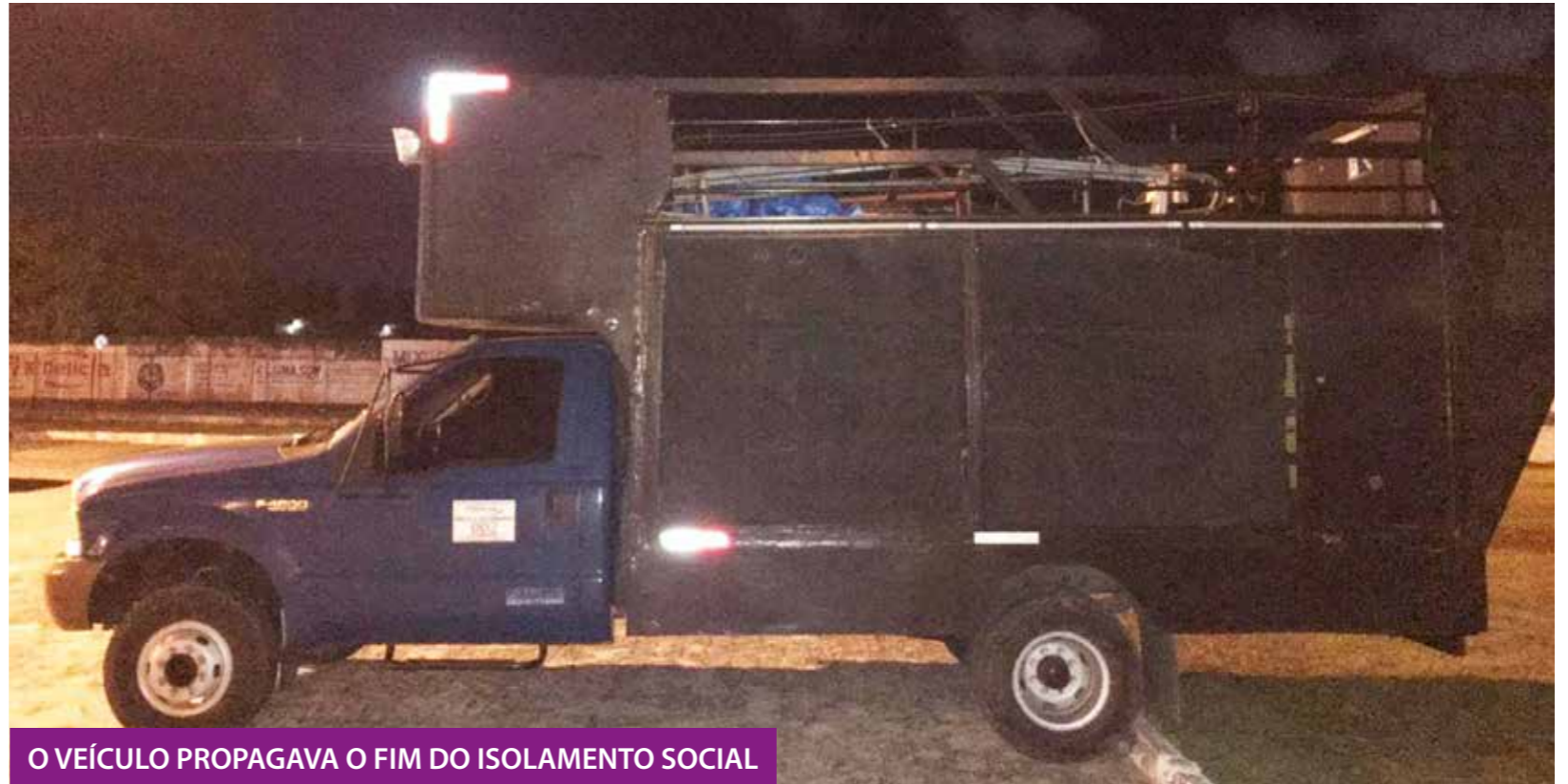
O VEÍCULO PROPAGAVA O FIM DO ISOLAMENTO SOCIAL

Duas pessoas foram interceptadas pela polícia, na noite de sexta-feira (1º), por estarem usando um carro de som para transmitir mensagens de incentivo para a população descumprir o decreto que previne a propagação do novo coronavírus, em João Pessoa, município que concentra mais de 60% dos casos da doença na Paraíba.