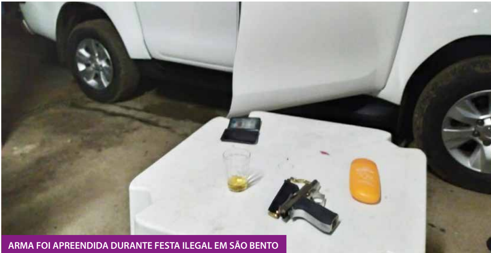
ARMA FOI APREENDIDA DURANTE FESTA ILEGAL EM SÃO BENTO

Policiais da 3ª Companhia do 12º Batalhão receberam na quinta-feira (30) denúncia de um som abusivo em uma área de lazer, no bairro São Bernardo, no município de São Bento (a 350 KM de João Pessoa) e que na mesma localidade foram ouvidos disparos de arma de fogo. Durante as diligências no local, a PM encontrou pessoas fazendo uso de bebidas alcoólicas, escutando música, e uma delas tentou esconder um objeto em um carro. A festa, um agrupamento capaz de propagar a pandemia, foi interrompida por ordem policial. Uma pessoa foi presa portando uma arma ilegalmente.