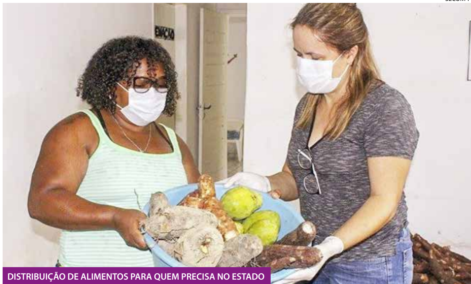
DISTRIBUIÇÃO DE ALIMENTOS PARA QUEM PRECISA NO ESTADO

As famílias beneficiadas foram dos municípios de Curral de Cima, Marcação, Mamanguape, Capim e Baía da Traição. 32 municípios das regiões do Vale do Piancó, Vale do Mamanguape e Litoral Sul serão beneficiados nos próximos dias. Até o momento, já foram atendidos 29 municípios. Os alimentos também estão sendo entregues às pessoas em situação de vulnerabilidade social, por meio dos Centros de Referência da Assistência Social (Cras).