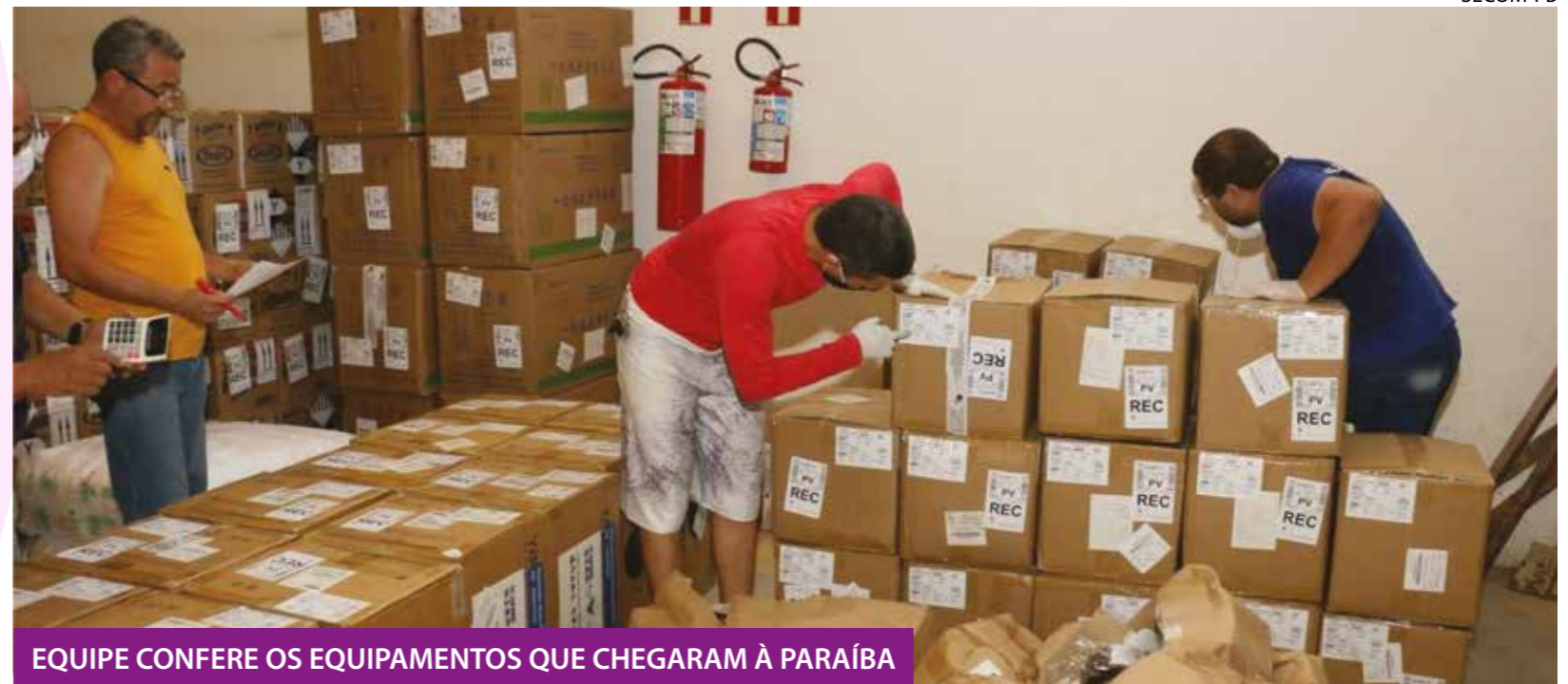
EQUIPE CONFERE OS EQUIPAMENTOS QUE CHEGARAM À PARAÍBA

Chegaram ao Estado neste sábado (2), os primeiros 20 respiradores enviados até o momento pelo Governo Federal (6 de transporte e 14 de UTI) para tratamento de pacientes diagnosticados com a Covid-19 na Paraíba. Destes, 10 irão para o Hospital Metropolitano para que sejam abertos novos leitos até a próxima sexta-feira (8). Assim, a unidade contabiliza 20 novos leitos, já que 10 foram abertos na semana passada.