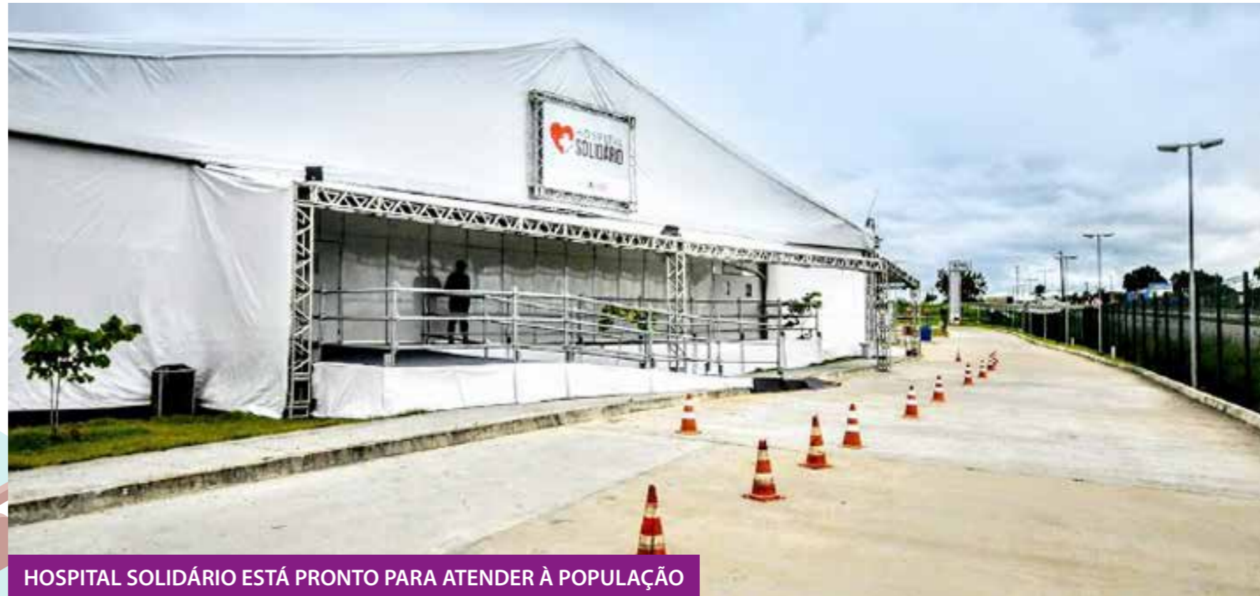
HOSPITAL SOLIDÁRIO ESTÁ PRONTO PARA ATENDER À POPULAÇÃO

A conclusão na segunda-feira (20) do hospital de campanha (Hospital Solidário), montado no estacionamento do Hospital Metropolitano Dom José Maria Pires, em Santa Rita, reflete o trabalho conjunto. São 130 leitos e equipe de 780 profissionais para atender à população.