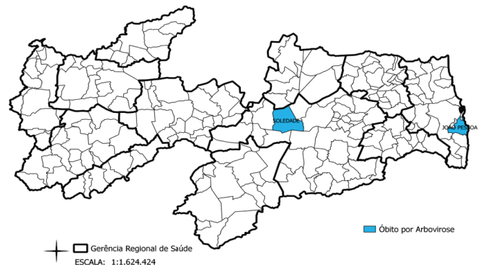
Figura 01 óbitos suspeitos por arbovirose segundo município de residência. Paraíba, Semana Epidemiológica 01 a 03 de 2019.

Dados preliminares sujeitos à alteração