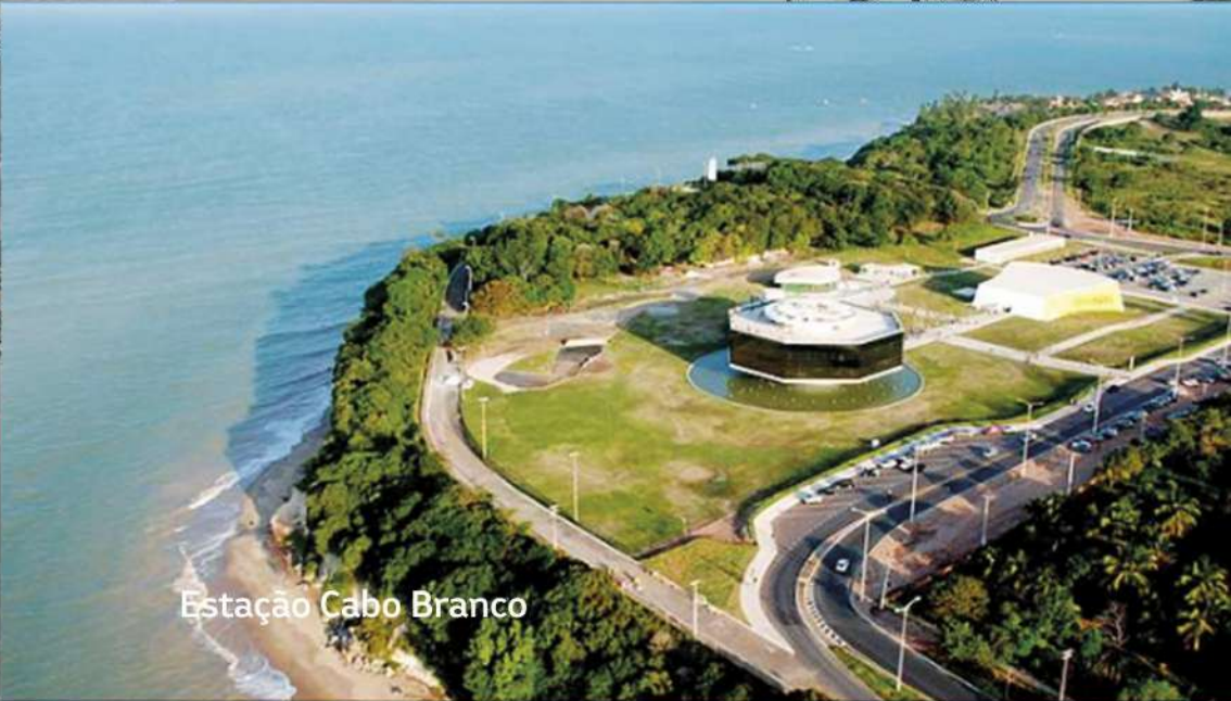
Estação Cabo Branco