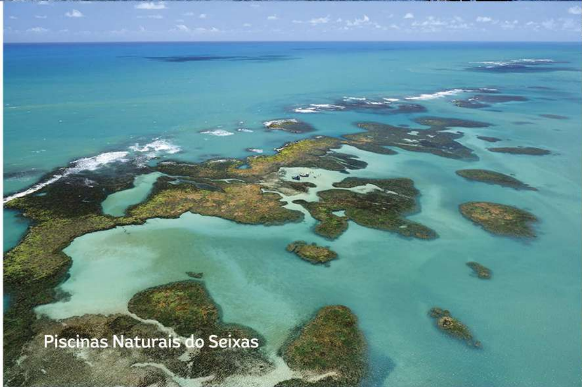
Piscinas Naturais do Seixas